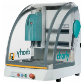
Fraiseuse à commande numérique